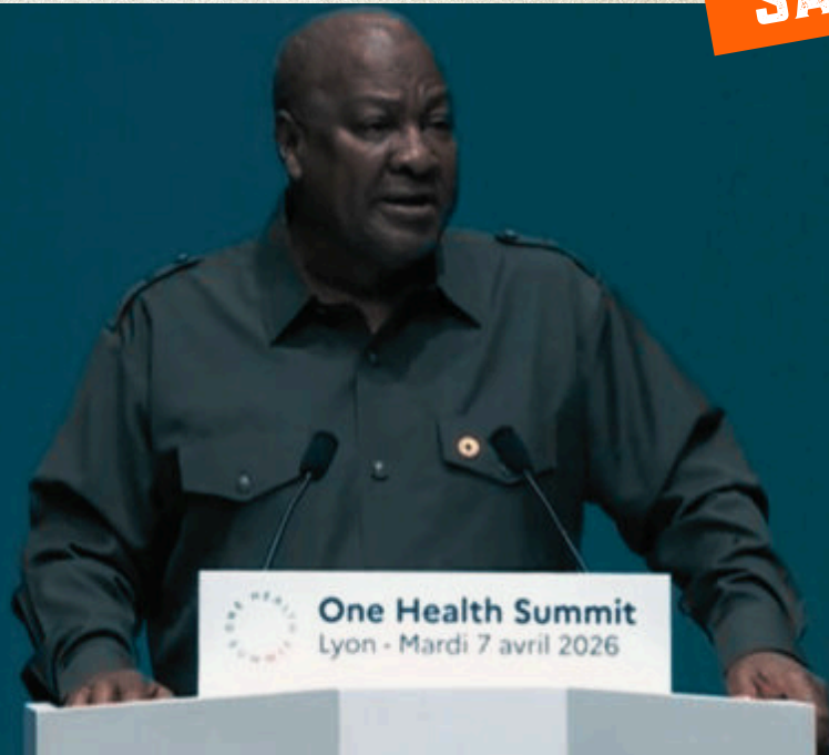
John Dramani Mahama